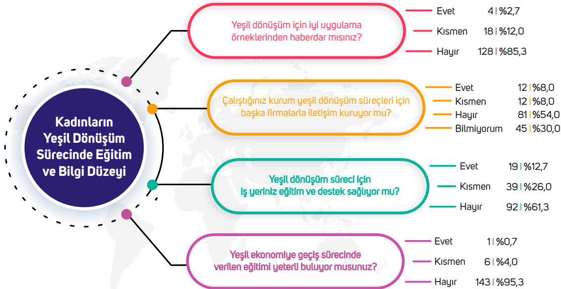
Tablo 5: Kadınların Yeşil Dönüşüm Sürecinde Eğitim ve Bilgi Düzeyi