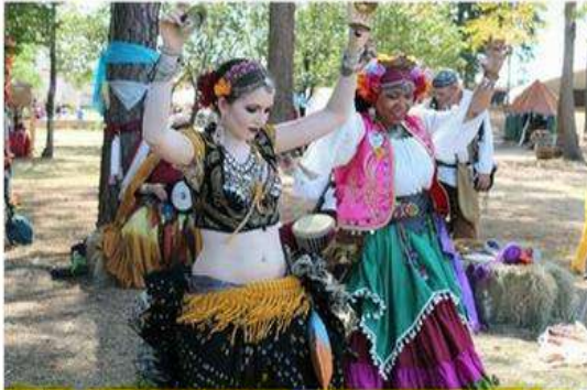
Koşullar ne olursa olsun, dansı, müziği ve eğlenceyi yaşam biçimi olarak gören çingenerler, neşeli hayatlarından taviz vermeyen bir topluluk

Tarih kayıtlarının Çingenerden bahsettiği ilk zamanlardan bu yana, merakın odağı haline gelmişler ve hem popüler kültürün hem de akademik çalışmaların en çok ilgi çeken konularından biri olmuşlar.